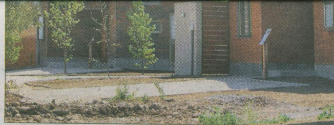
MEZCLA. — En Peñalolén hay un desarrollo inmobiliario dirigido a los segmentos más altos de la población.

10% más rico Ingreso promedio de $3,2 millones